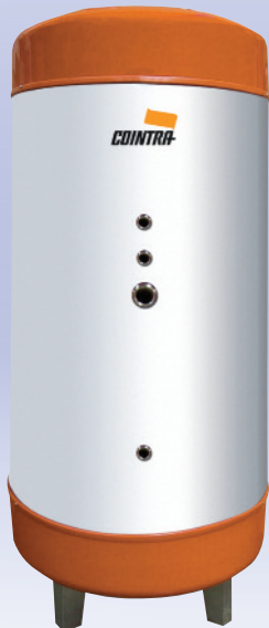
Coloración correspondiente a modelos de hasta 750 L. A partir de 1.000 L la coloración es totalmente blanca.

- Acumuladores de ACS (sólo almacenamiento). - En acero inoxidable AISI-316.